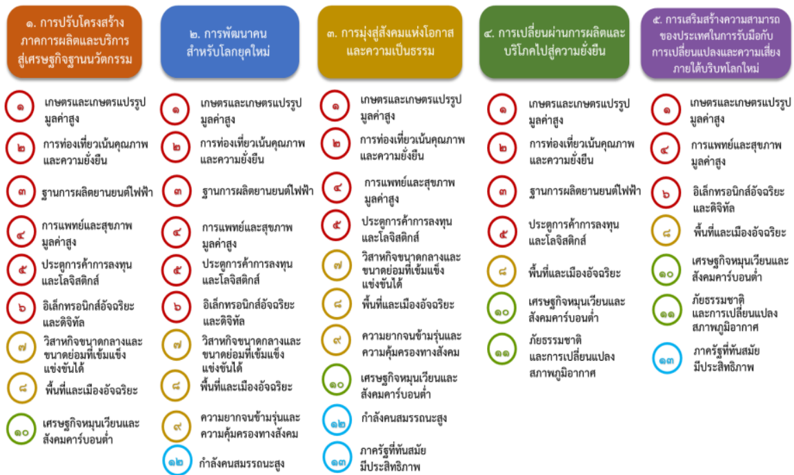
แผนภาพที่ ๓.๑ ความเชื่อมโยงระหว่างหมวดหมู่การพัฒนา กับเป้าหมายหลัก

ความเชื่อมโยงระหว่างหมวดหมู่การพัฒนา กับเป้าหมายหลักแสดงไว้ในแผนภาพที่ ๓.๑ โดยหมวดหมู่ การพัฒนาที่กำหนดขึ้นเป็นประเด็นที่มีลักษณะเชิงบูรณาการที่ครอบคลุมการพัฒนาตั้งแต่ในระดับต้นน้ำจนถึง ปลายน้ำ และสามารถนำไปสู่ผลพัฒนาทั้งในมิติเศรษฐกิจ สังคม ทรัพยากรธรรมชาติและสิ่งแวดล้อมไปพร้อมๆ กัน ทำให้หมวดหมู่แต่ละประการสามารถสนับสนุนเป้าหมายหลักได้มากกว่าหนึ่งข้อ นอกจากนี้การพัฒนาภายใต้แต่ละ หมวดหมู่ไม่ได้แยกขาดจากกัน แต่มีการสนับสนุนหรือเอื้อประโยชน์ซึ่งกันและกัน